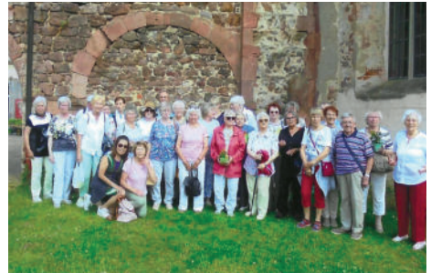
Senioren-Exkursion am 18. Juni 2025 ins Muldental; Foto: Sigrid Knutzen