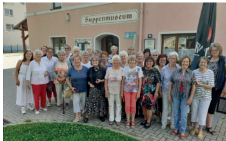
Tanz-Exkursion am 25. Juni 2025 nach Neudorf/Erz.; Foto: Gabriele Schreiter